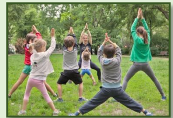
Abbildung 5 https://www.nadineoosenbrugh-yoga.de/kinderyoga/

Spielerisch bringen wir Naturgesetze und –Phänomene näher und wagen uns ohne Druck an wissenschaftliche Arbeitstechniken heran. Selbstverständlich ohne dabei explizitem Schulstoff vorzugreifen. Die Kinder sollen neugierig gemacht und für naturwissenschaftliche Vorgänge sensibilisiert werden. Mit viel Spaß und Eigeninitiative begeben wir uns auf eine Reise durch die Physik, Mathematik, Chemie und Biologie. Teilweise dürfen die Versuchsobjekte mit nach Hause genommen werden. Während des Unterrichts stehen Wasser und Bio-Obst/Gemüse zur Verfügung.