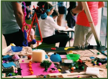
Abbildung 4

WAS? WANN? FÜR WEN? KOSTEN? ANMELDUNG UND INFOS unter: